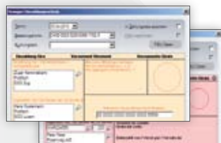
Bulletin de versement orange ou rouge

Que vous vouliez gérer votre compte PostFinance, votre compte en banque ou plusieurs contrats d'e-banking, votre CLX.PayMaker est toujours de la partie. L'avantage: vous gérez tout votre trafic des paiements sur une seule et même plate-forme et gardez à tout moment une vue d'ensemble de tous vos comptes et de leurs soldes respectifs.